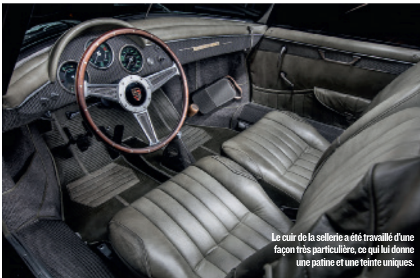
Le cuir de la sellerie a été travaillé d'une façon très particulière, ce qui lui donne une patine et une teinte uniques.