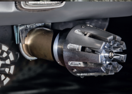
Clin d'œil des designers d'Hédonic, l'échappement est finalisé par deux silencieux "turbine".